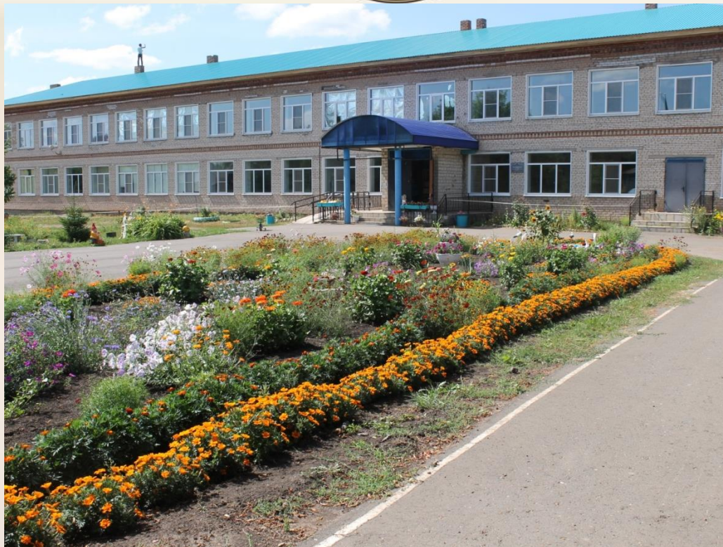
МОБУ «Державинская СОШ» фото 2017 г.