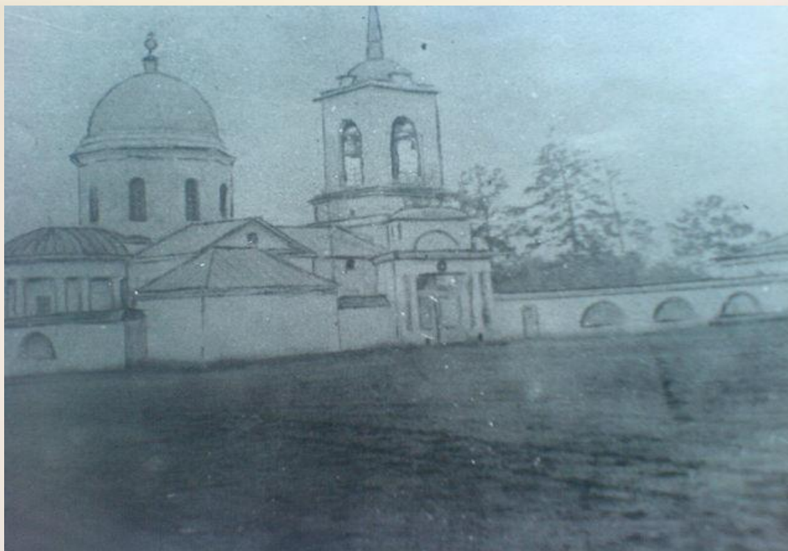
Храм во имя Смоленской Божией матери с.Державино фото 1906г.